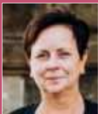
Mirjam Golm, MdB Gleichstellungspolitische Sprecherin