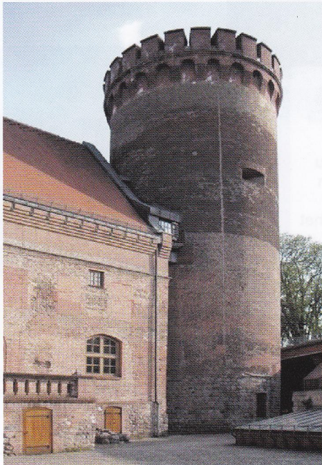
Juliierturm in der Zitadelle Spandau

Das Anbringen von Plakaten und das Auslegen von Prospekten auf der Strecke und an den geparkten Fahrzeugen ist gesetzlich verboten. Abfälle bitte nur in die bereitgestellten Abfallbehälter werfen. Bei der Überquerung bzw. der Benutzung von Straßen ist die StVO zu beachten. Mitgeführte Tiere sind an der Leine zu führen. Rauchen ist im Park oder Wald verboten. Wenige Parkmöglichkeiten am Start / Ziel.