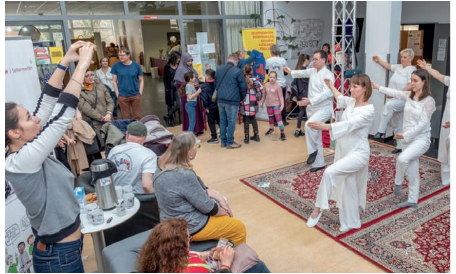
Abwechslungsreiches Falkenhagener Feld

Die vielfältigen Projektträger der „Sozialen Stadt“ und weitere quartiersbezogene Akteure und Initiativen stellten sich und ihre Arbeit in einem „Sightseeing“ Format mit Marktständen, Stelltafeln und Mitmach-Aktionen für Groß und Klein vor. Es wurde sichtbar, wie bunt, abwechslungsreich und aktiv