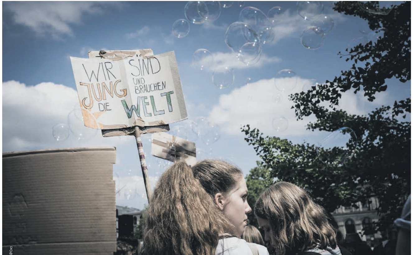
Klimastreik von Fridays for Future