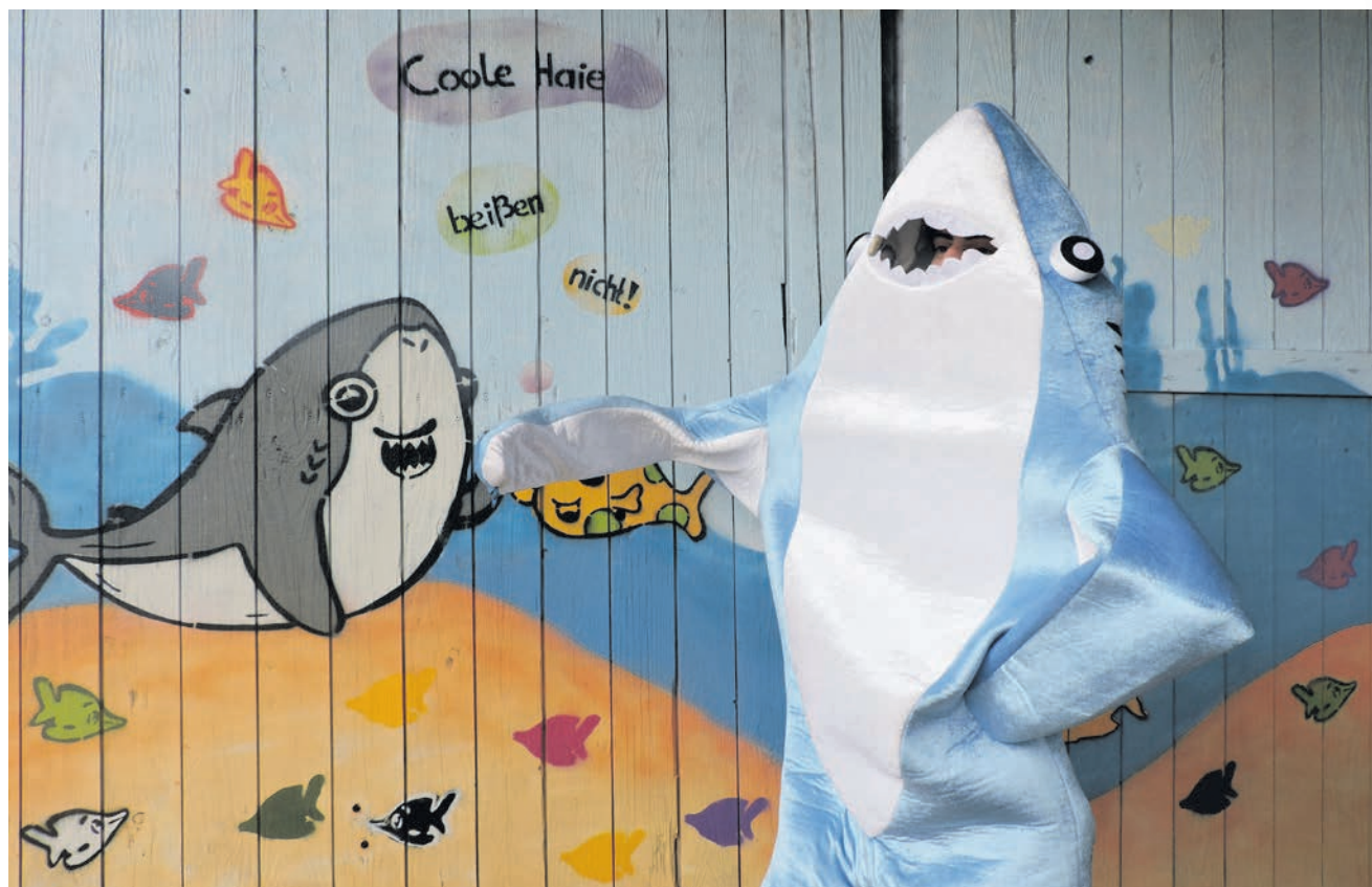
Der Haifisch des Bildungsforums sucht noch einen Namen!