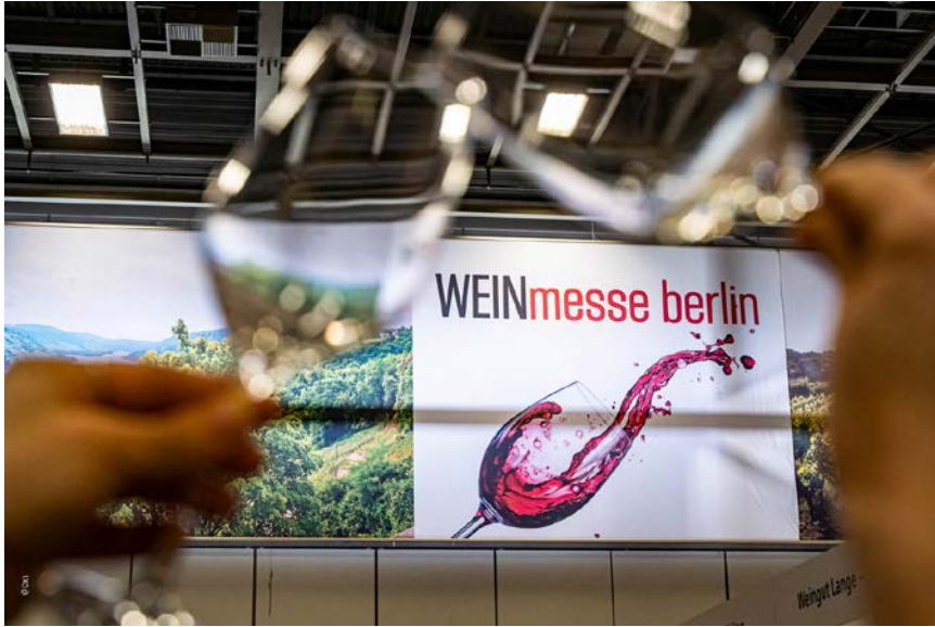
WEINmesse berlin im Februar 2020

Ein Ausflugsziel, das sich für die Spandauer lohnt