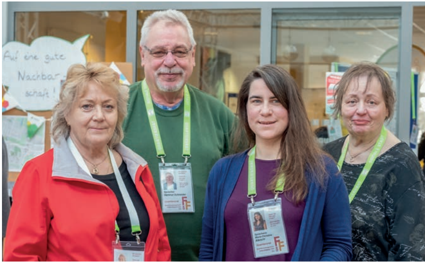
Quartiersräte stellten sich den Fragen der Anwohnerschaft

Am Samstag, den 29. Februar 2020 fand im Klubhaus in der Westeraldstraße in der Zeit von 15 bis 20 Uhr das 8. Bürgerforum im Falkenhagener Feld statt. Organisiert und durchgeführt wurde die Veranstaltung gemeinsam von beiden Quartiersmanagement-Teams Ost und West, dem Programm BENN, dem Klubhaus-Team und dem Verein KNiFF e.V. Mit insgesamt ca. 170 Teilnehmer*innen wurde ein neuer Rekord aufgestellt. Zu den Besucher*innen zählten neue wie auch bekannte Gesichter aus der Nachbarschaft sowie zahlreiche Vertreter*innen von Institutionen und Vereinen aus dem Falkenhagener Feld. Die Besucher*innen, darunter