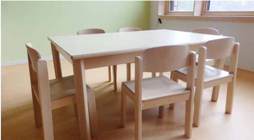
Tischlein deck' dich